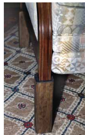
Altezza di seduta non idonea e idonea