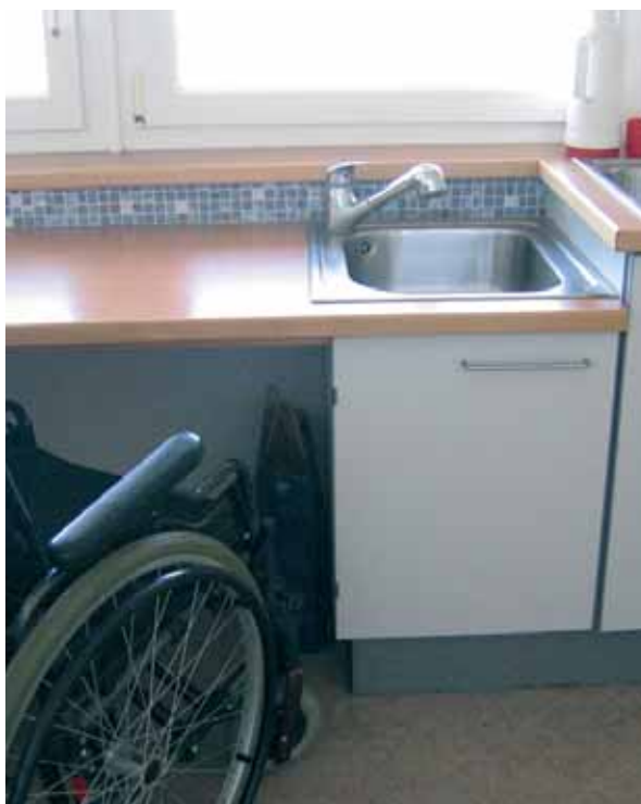
Piano di lavoro accessibile a sedia a rotelle