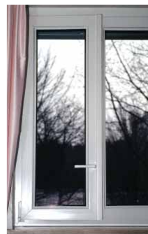
Maniglia della finestra in basso