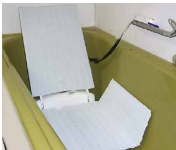
Il sollevatore rende possibile l'uso della vasca