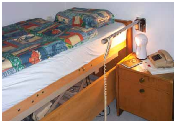
Maniglia per alzarsi e coricarsi in sicurezza