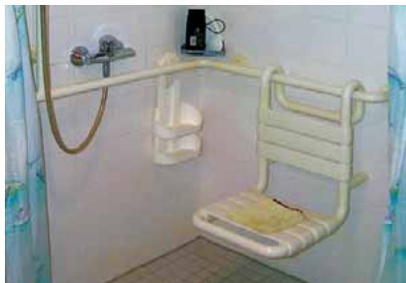
Il seggiolino da doccia va fissato accuratamente

Se si sta realizzando una ristrutturazione, si consiglia di installare una porta sufficientemente larga o di sostituirla con una porta scorrevole.