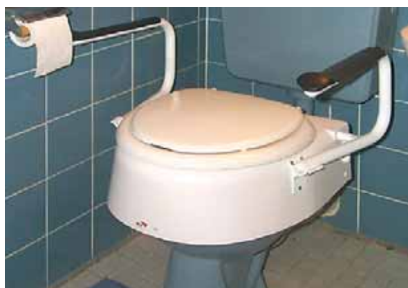
I maniglioni facilitano l'utilizzo del gabinetto