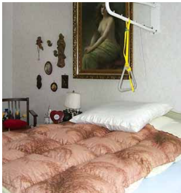
La maniglia aiuta ad alzarsi

Accanto al letto deve essere presente un ampio piano di appoggio per avere a portata di mano il telefono, il dispositivo per le chiamate d'emergenza e tutto ciò di cui si ha spesso bisogno.