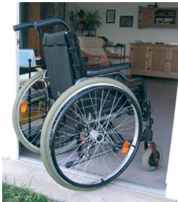
Senza soglia: libero accesso al giardino