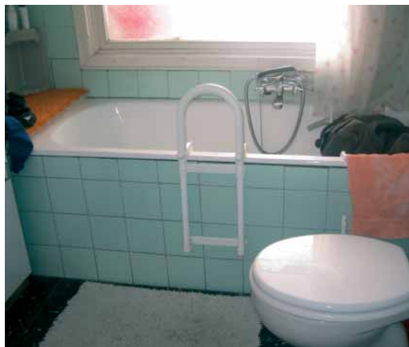
Maniglione: buona tenuta e sicurezza

Chi non è più in grado di fare il bagno, può sostituire la vasca con una doccia. Nella maggior parte delle abitazioni questa modifica può essere realizzata con il consenso del proprietario. In questo caso, si consiglia di installare la doccia a filo del pavimento.