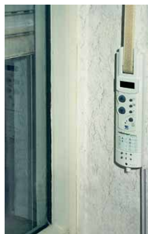
Motore per tapparelle di casa