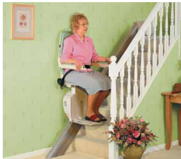
Il montascale: sono possibili adattamenti individualizzati

Probabilmente un montascale rappresenta la soluzione più adatta per chi non è più in grado di salire le scale da solo. Al giorno d'oggi il mercato propone molti modelli che, a seconda del tipo di scala, possono essere montati sia a parete sia sul lato interno della scala stessa. Se necessario, si può prendere in considerazione l'installazione o l'inserimento di un ascensore speciale per sedia a rotelle. Prima di effettuare qualsiasi intervento di modifica e per poter individuare il modello più adatto, è importante verificare le norme tecniche vigenti in materia di edilizia. Se in casa abitano più inquilini, può non essere possibile installare un montascale per non limitare l'utilizzo della scala come via di fuga. È possibile anche installare sistemi di supporto per consentire alle persone costrette sulla sedia a rotelle di salire le scale; questi sistemi richiedono però sempre la presenza di una persona in aiuto.