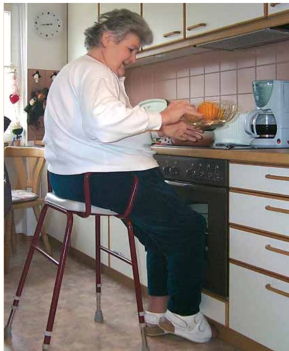
Un sedile rialzato facilita il lavoro

In genere è utile eliminare le fonti di pericolo ed evitare postazioni di lavoro scomode.