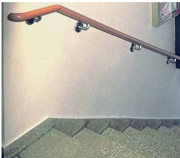
Il corrimano: la lunghezza deve superare l'ultimo gradino di almeno 30 cm

L'illuminazione deve essere sufficiente e il timer va regolato in modo che la luce non si spenga improvvisamente nei tratti di scala più lunghi. Se lo spazio disponibile lo consente, si possono prevedere dei sedili per soste temporanee. La tromba delle scale può essere adattata nel tempo per rispondere