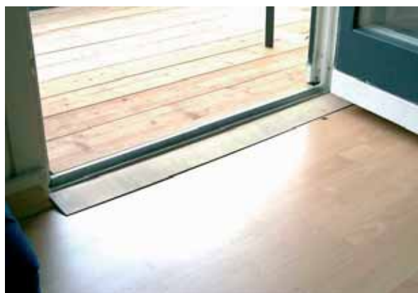
Dopo: senza ostacolo