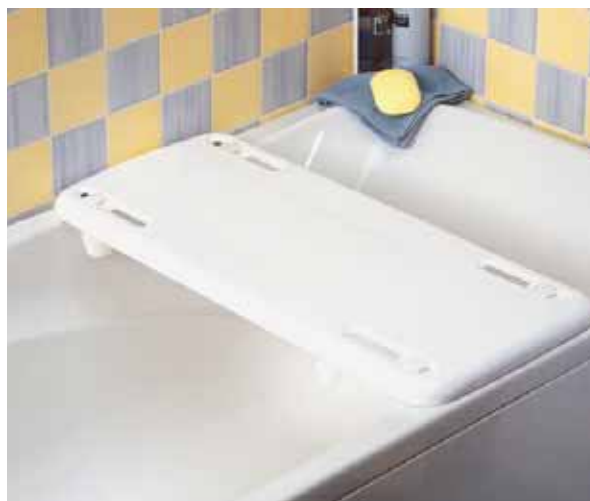
Seggiolino per fare la doccia da seduti